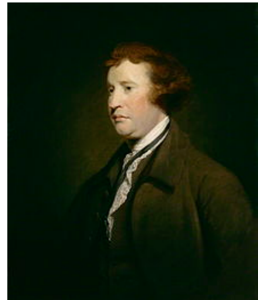
From Wikimedia Commons