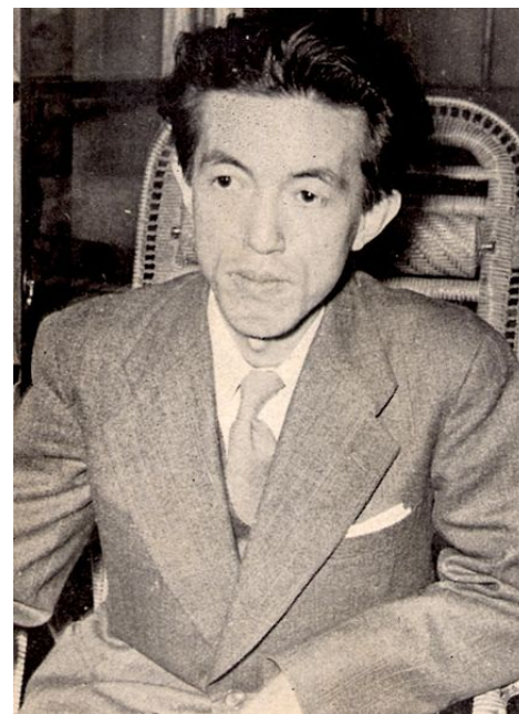
From Wikimedia Commons