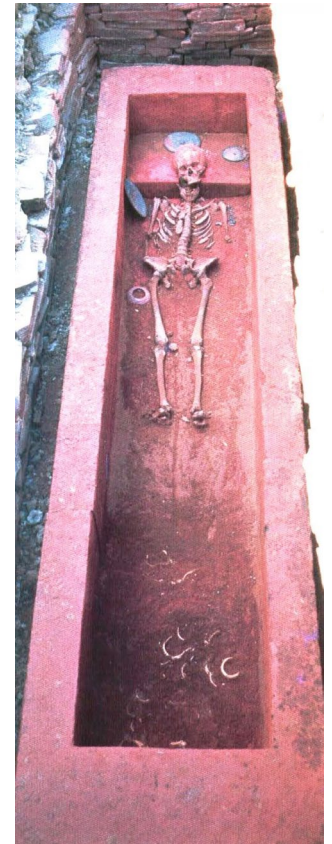
宇土市役所ホームページ “向野田(むこうのだ)古墳” https://www.city.uto.lg.jp/article/view/1102/1807.html