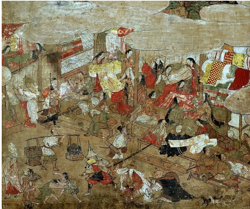
東京国立博物館,月次風俗図屏風 https://www.tnm.jp/modules/r_collection/index.php?controller=other_img&size=L&colid=A11090&img_id=19&t=type&id=11

【史料】 16世紀、京都の呉服屋店頭イメージ（東京国立博物館蔵「月次風俗図屏風」）