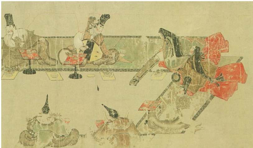
『餓鬼草紙』,写.