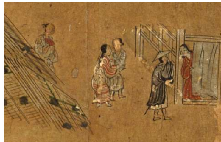
国立歴史民俗博物館ウェブサイト, 洛中洛外図屏風（歴博甲本） 【仕事・しぐさ】, https://www.rekihaku.ac.jp/education_research/gallery/webgallery/rakutyuu/theme/work02.html