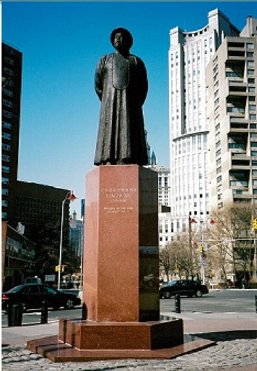
林則徐 in NY